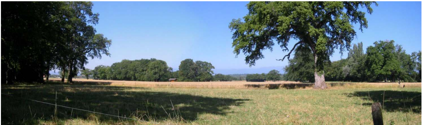
Vues de la mairie et de la campagne de Presinge

Le cahier des charges du projet de plan directeur élaboré par les autorités de Presinge précise les principaux axes sur lesquels la politique communale s'appuiera dans les années à venir: