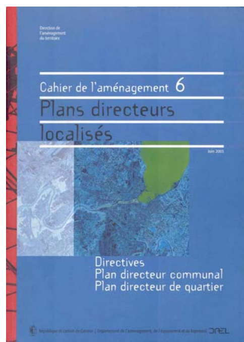
Guide des plans directeurs localisés, DAEL 2003

Ainsi, si le rôle premier d'un plan directeur communal est d'assurer la coordination entre des démarches de natures diverses ayant des incidences sur le territoire, il est surtout l'occasion pour la commune d'élaborer et de mettre en discussion une vision d'avenir, qui se traduira par une image directrice et sera accompagnée d'un plan d'actions échelonnées dans le temps.